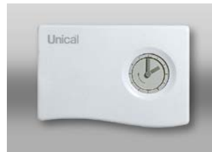
CRONOTERMOSTATO GA 240 ON/OFF settimanale