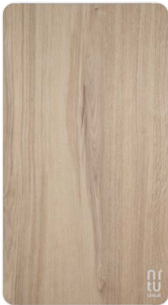
Pannello frontale light oak (rovere)