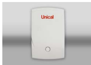
MODULO GESTIONE ZONE OT