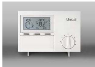
CRONOTERMOSTATO REGOLAFACILE ON-OFF